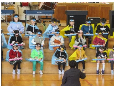
1年生「Let's Go きらきら星!」