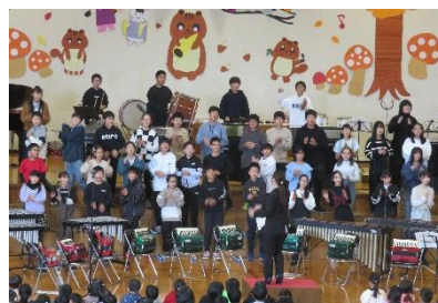
6年生 合唱「This is Me」