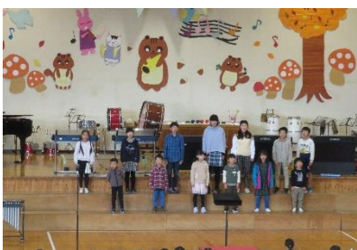
川島小 記念ソング「150の希望」