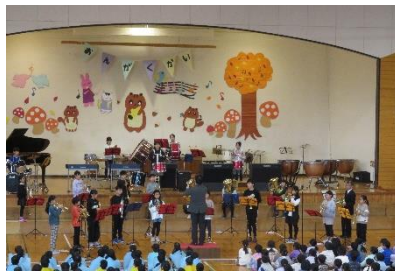
金管バンド「新時代」