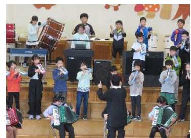
4年生 合奏「Under The Sea」