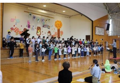
3年生 リコーダー奏「エデンの東」