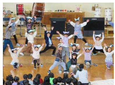
2年生音楽劇「6! ぴきのネコ」