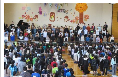
全校 合唱「歌よありがとう」