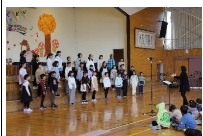
合唱団「上伊那地方のわらべうた」