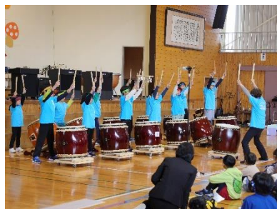
辰西太鼓「ほたる祭り」