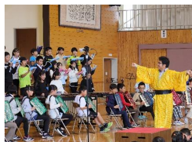
5年 合奏「マツケンサンバII」