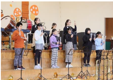
きれいなベルの音で始まりました。

去る10月20日(金)に、校内音楽会が行われました。本年度も川島小学校と一緒に行うことができました。それぞれ練習を積み重ね、本番ではすばらしい合唱・演奏を発表することができました。たくさんのご来賓の皆様、保護者の皆様にご覧いただきました。ありがとうございました。